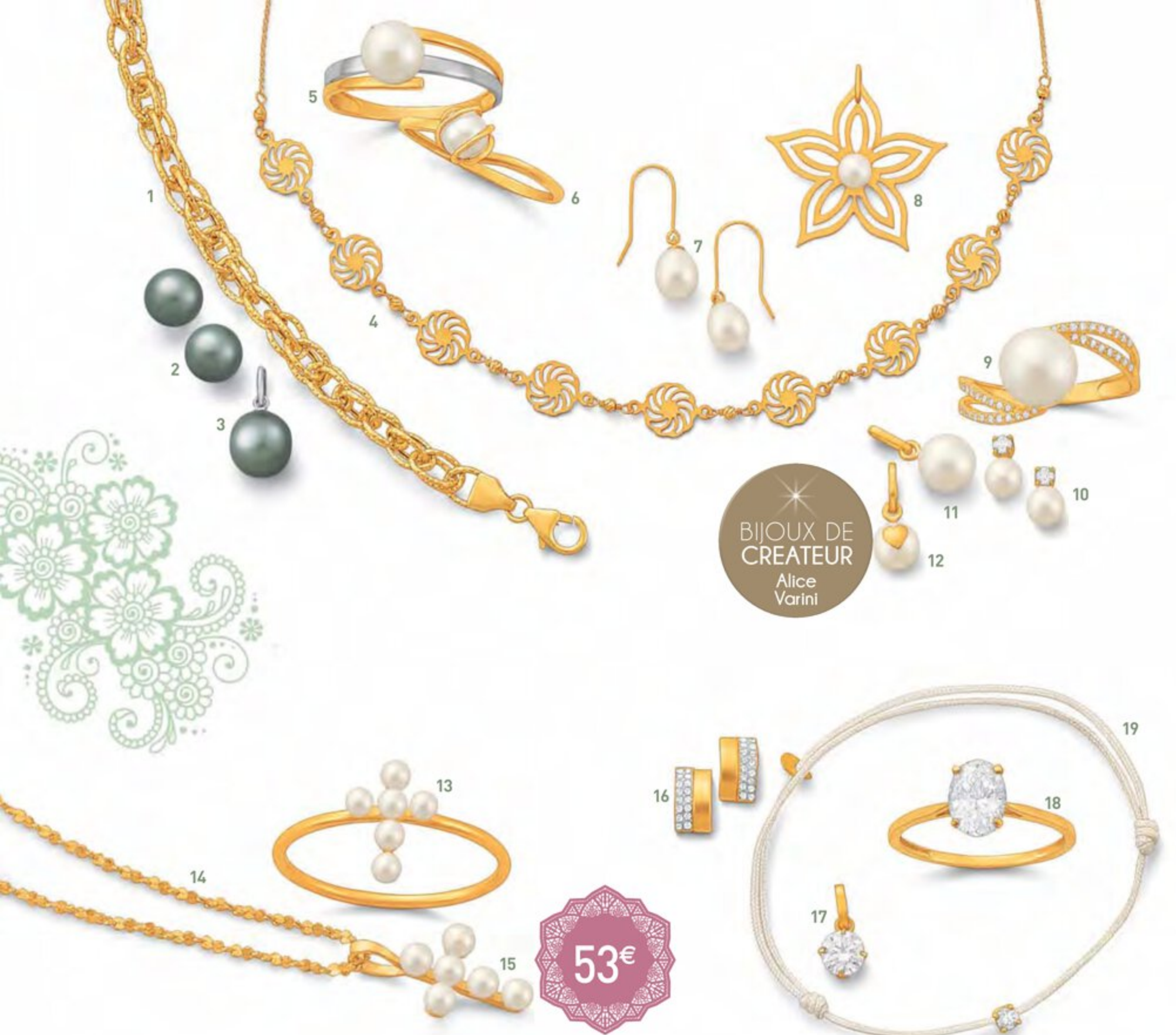
1. bracelet maille fantaisie, 18 cm, or jaune 4,71 g, 239,00 € • 2. boucles perle de culture de Tahiti, or jaune 0,60 g, 142,80 € • 3. pendentif perle de culture de Tahiti, or jaune 0,20 g, 53,90 € • 4. collier, 42 cm, or jaune 2,41 g, 170,30 € • 5. bague perle de culture, taille 54, or jaune et rhodié 1,70 g, 124,80 € • 6. bague perle de culture, taille 54, or jaune 1,07 g, 92,80 € • 7. boucles perle de culture, or jaune 0,41 g, 46,80 € • 8. pendentif perle de culture, or jaune 0,91 g, 83,70 € • 9. bague perle de culture et oxydes de zirconium, taille 54, or jaune 1,62 g, 150,00 € • 10. boucles perle de culture et oxyde de zirconium, or jaune 0,60 g, 51,70 € • 11. pendentif perle de culture, or jaune 0,12 g, 30,90 € • 12. pendentif perle de culture, or jaune 0,24 g, 42,50 € • 13. bague perles de culture, taille 54, or jaune 1,21 g, 119,00 € • 14. chaîne maille torsadée, 42 cm, or jaune 1,42 g, 88,00 € • 15. pendentif perles de culture, or jaune 0,22 g, 53,00 € • 16. boucles cristaux de synthèse et résine, or jaune 0,64 g, 58,50 € • 17. pendentif oxyde de zirconium, or jaune 0,39 g, 28,40 € •