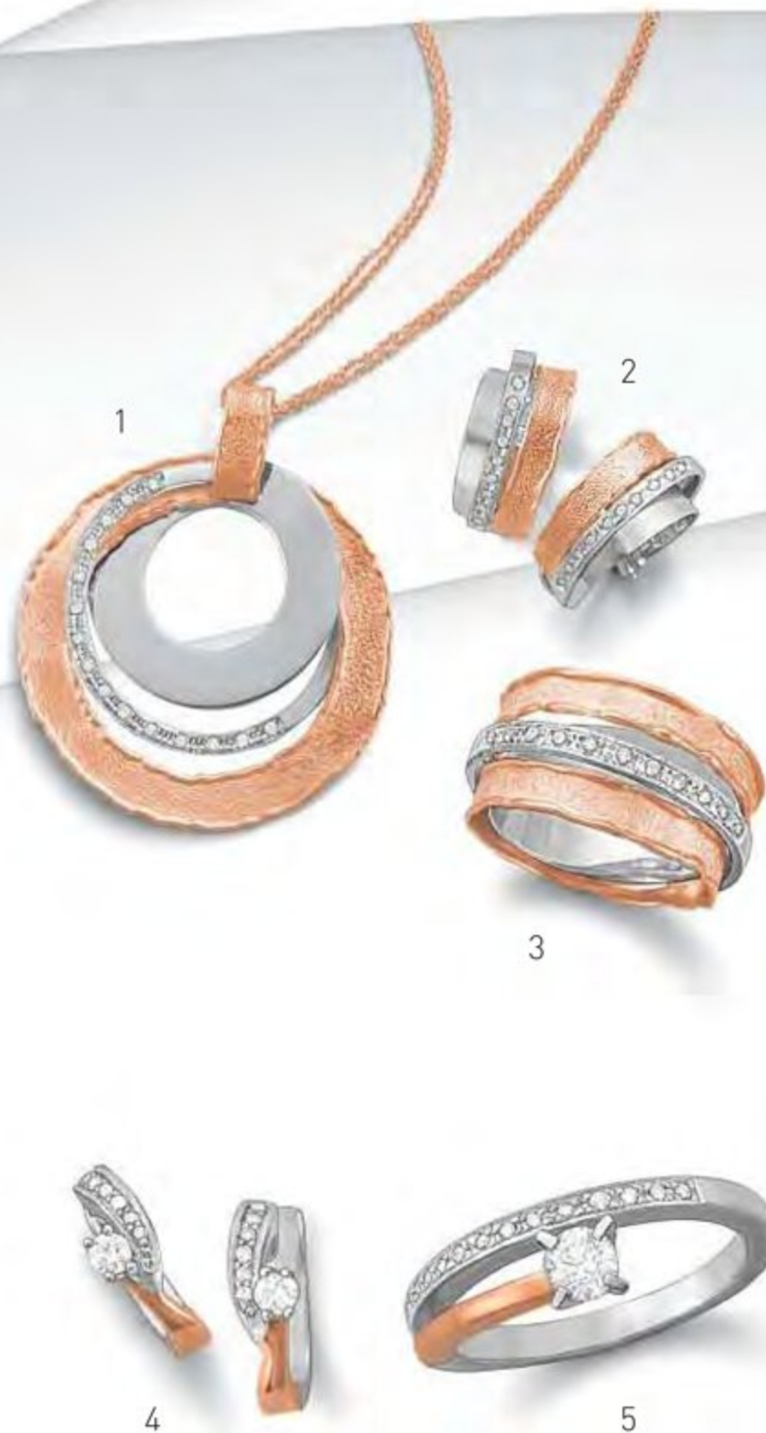
1 - LE COLLIER EN OR ROSE MAT ET OR GRIS 15 DIAMANTS Taille Brillant rond 0.19 ct Disponible en deux ors - Qualité HVS