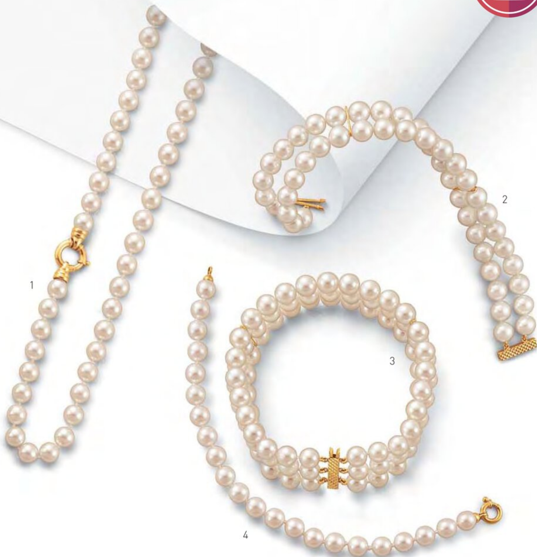
1 - COLLIER CHOKER 1 RANG PERLES DE CULTURE AKOYA Diamètres de 6.5/7 à 8.5/9 mm