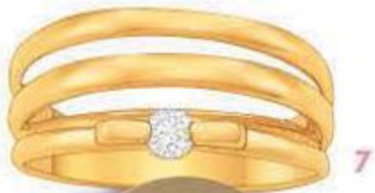
BIJOUX DE CREATEUR Alice Varini