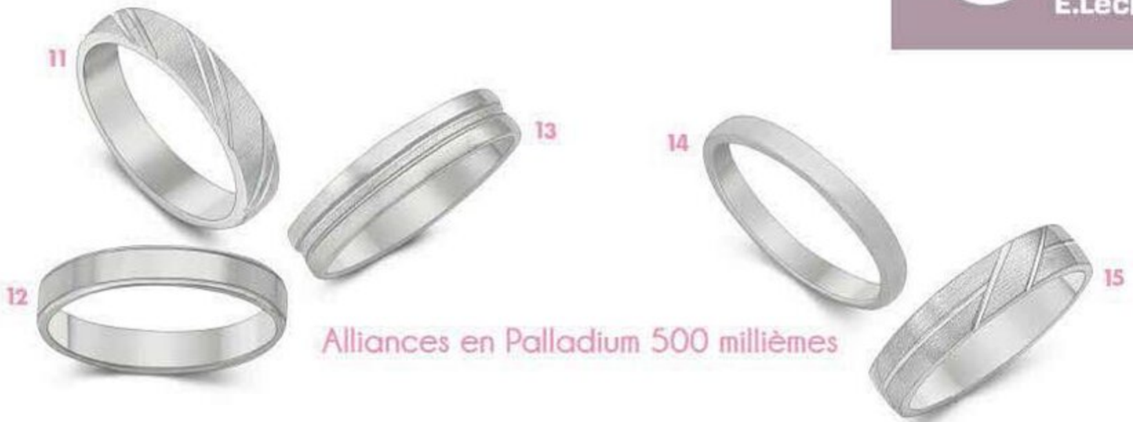
Alliances en Palladium 500 millièmes