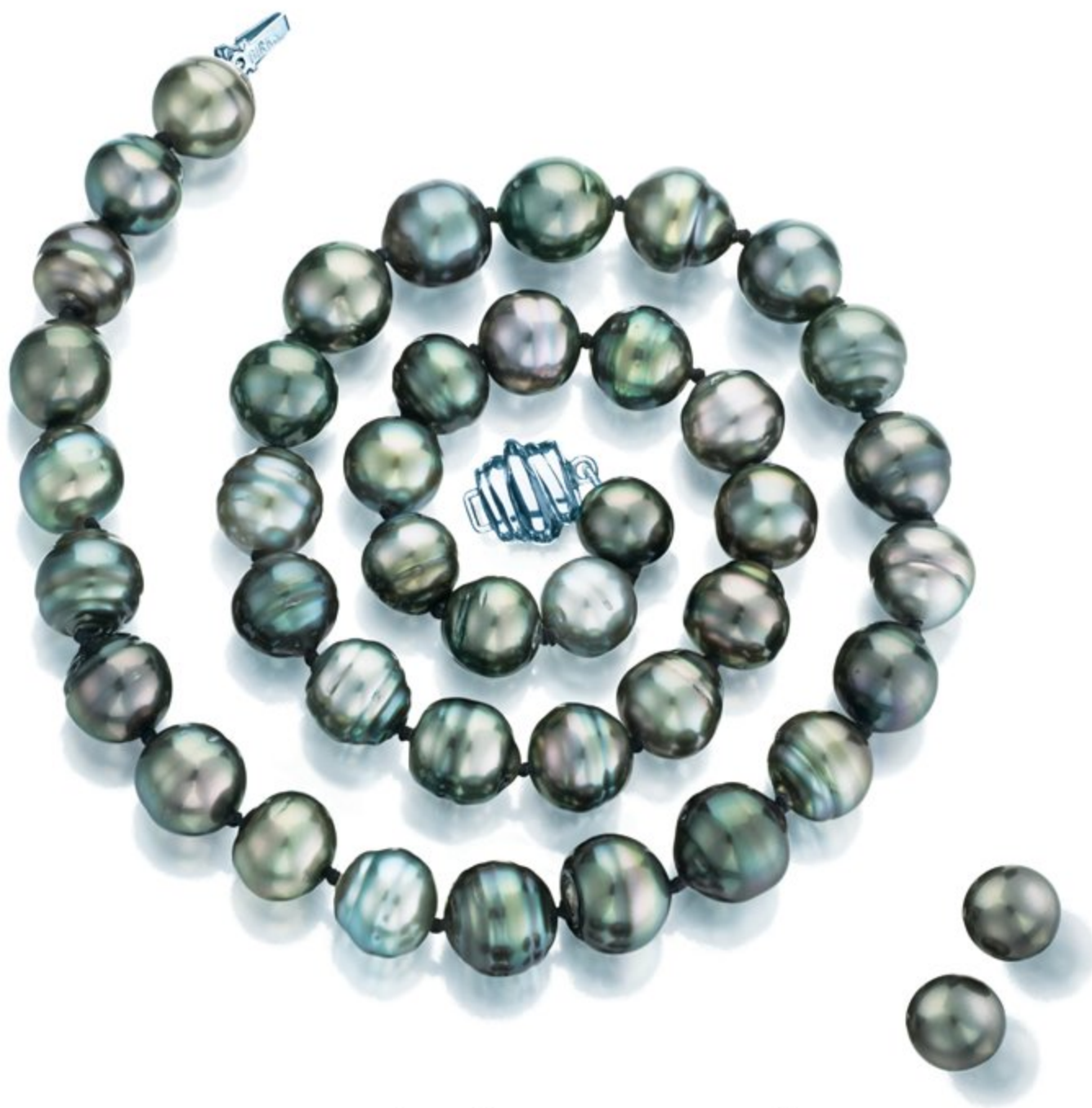
PERLES CULTIVÉES À TAHITI SIGNÉES BIRKS