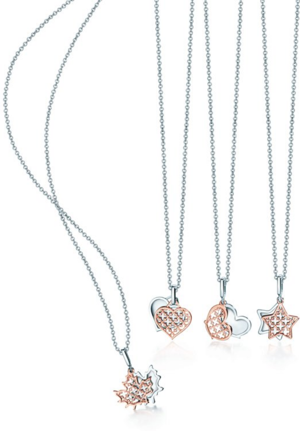
BIRKS MINI MUSE