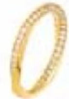
28. Séléna – 1104.0045J Or jaune – Diamants Tour complets 0.45 ct