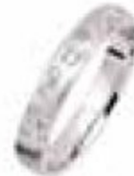
27. Constellation – CONST35GGOM Or blanc Emeri gomme – Diamants 0.16 ct – 3,5 mm