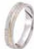
60. Boavista Deux ors 4 mm