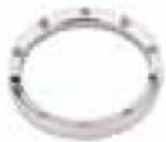
29. Cronos – CRONOS320G Or blanc – Diamants 0.20 ct – 3 mm