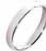
8. Fidélis Or blanc 3 mm