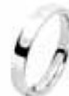
12. Jonc Parisien Prestige Or blanc 3,5 mm