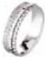
41. DCB Or blanc 5 mm