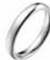
4. Jonc Parisien Prestige Platine 3,5 mm