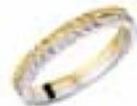
48. Double Alicante Or jaune – Platine 3 mm