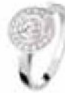
35. Solitaire Paris Or blanc – Diamant de centre 0.50 ct H-SI – Pavage 0.18 ct