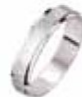
72. Sao Or blanc 4 mm