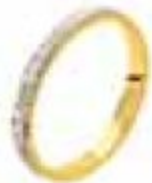
58. Castel Deux ors 2,5 mm