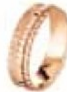
43. DCB Or rose 5 mm