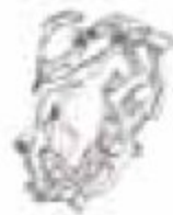
38. Jardin Secret Forever Or blanc – Diamants 0.21 ct – Saphirs bleus 0.14 ct – Grand modèle