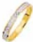
62. Métis Deux ors 3 mm