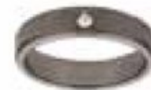
84. San Remo 8010.0005RHN Or blanc rhodiage noir Diamant 0.05 ct – 5 mm