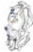
39. Jardin Secret Forever Or blanc – Diamants 0.10 ct – Saphirs bleus 0.10 ct – Petit modèle