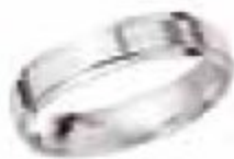
70. June Or blanc 4 mm