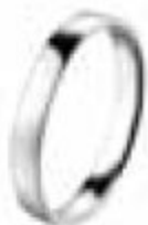
5. Fidélis Parisienne Platine 3 mm