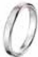
69. Bonheur Tranche Arrondie Or blanc mat – Tranches arrondies vives 2,5 mm