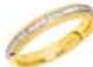
59. Granada Deux ors 2,5 mm