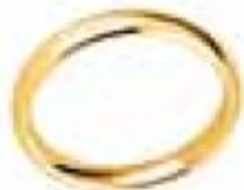
2. Jonc Parisien Or jaune 3,5mm