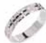
56. Dominica Or blanc 4 mm