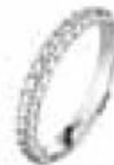
47. Acapulco Or blanc 3 mm