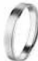
7. Bordelaise Platine 4 mm