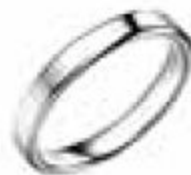
3. Bonheur Tranche Arrondie Platine 3 mm