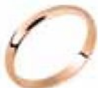
9. Demi Jonc Or rose 2 mm