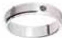
83. San Remo 8010.0005GN Or blanc – Diamant noir 0.05 ct – 5 mm