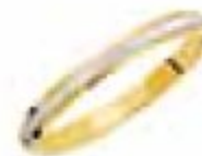
64. Maïa Deux ors 2,5 mm