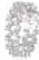
19. Double One – D-One64G Or blanc – Diamants Tour complets 0.64 ct