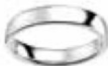
6. Superbe Platine 4 mm