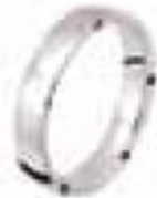
30. Cronos – CRONOS4510GN Or blanc – Diamants noirs 0.10 ct – 4,5 mm