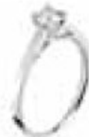
31. Solitaire Champs Elysée Or blanc – Diamant de centre 0.50 ct H-SI