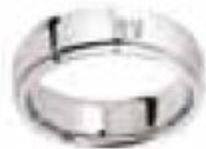
82. Salerno 8009.0008G Or blanc – Diamant 0.08 ct – 7 mm