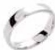
11. Superbe Or blanc 4 mm