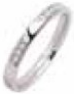
21. Alexa – 1007.0024G Or blanc – Diamants Tour complets 0.24 ct – 2,5 mm