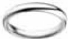
1. Jonc Parisien Platine 3 mm