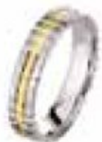
74. Mykonos Deux ors mats 4,5 mm