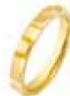
75. Pyramid Or jaune 3 mm