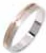
78. Pemba Deux ors 4 mm