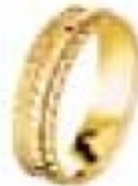
42. DCB Or jaune 5 mm