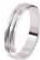
71. Diego Or blanc 4,5 mm