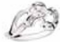
40. Solitaire Jardin Secret Or blanc – Diamant de centre 0.50 ct H-SI