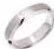
79. Blake Or blanc 5 mm