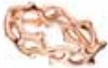
37. Jardin Secret Or rose – Petit modèle