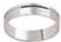
77. Pétunia Or blanc 5 mm