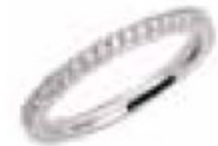
24. Coralie – 1003.0020G Or blanc – Diamants 0.20 ct – 2 mm